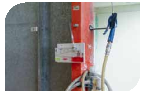
涂装设备压力控制